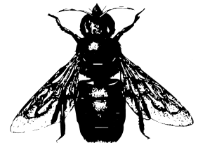
avispa maderera o cortadora