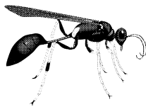
avispa embarradora o lodera